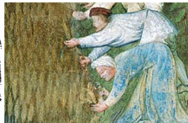
6 MIETERE 7 GRANO